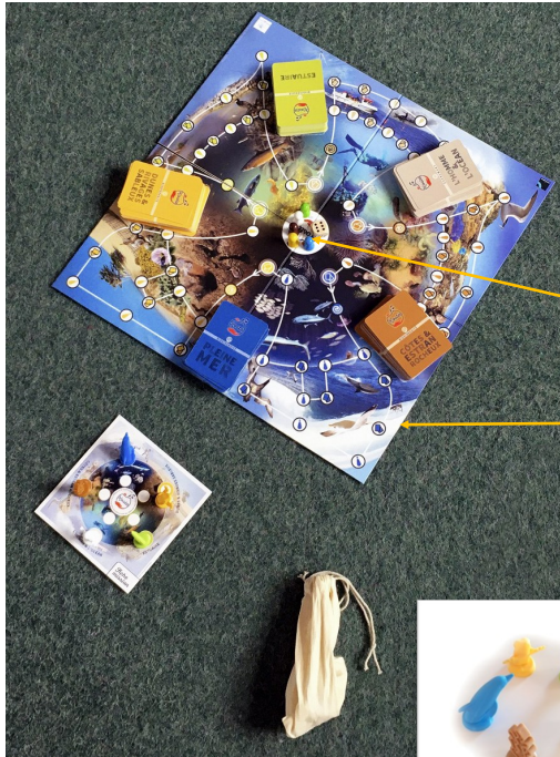
Pochon en coton